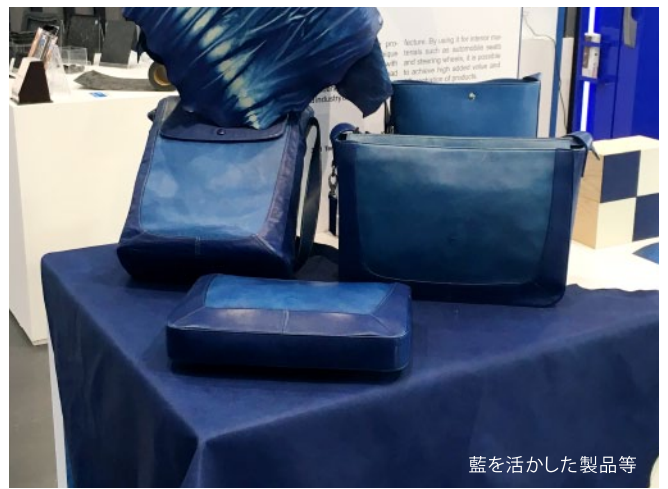
藍を活かした製品等