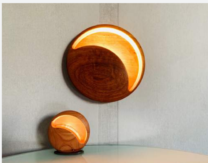
ナチュラルバージョン