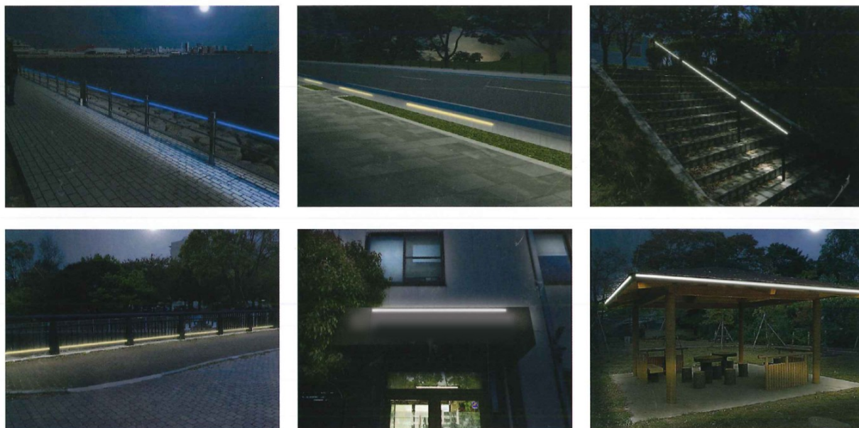
設置イメージ イメージ図ですので実際の発光とは異なります。

太陽光で発電したエネルギーをリン酸鉄リチウムイオン電池に蓄電し、暗くなると自動的にLEDが点灯します。