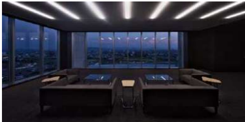
リズムカルかつ柔らかな明かりが 空間を優雅に演出