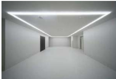
直線デザインの組み合わせで大胆な デザインも可能に