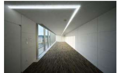
光線が天井から壁につながる 新しい意匠を実現